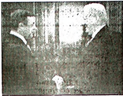
Президентът Борис Елцин и Геннадий Селезньов

Осведомявайки колегите си, че е информирал президента Елцин за настоящото положение в Югославия, Селезньов подчерта: "Завърнахме се от Югославия с твърда увереност, че Югославия без помощта на Русия не може сама да излезе от това положение". Той оповести, че "президентът Слободан Милошевич и председателят на Скуп-