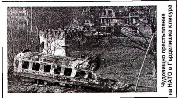
Чудовищно престъпление на НАТО в Гърделишка клисура

На тази основа ние виждаме политическия процес и на тази основа се водят разговорите между представители на правителствата на Сърбия и СР Югославия и представители на косметските албанци. Ние смятаме, че тези разговори трябва да бъдат непосредствени. Те, както вече ви е известно, се водят вече пряко и сме уверени, че само по този начин, значи чрез преки