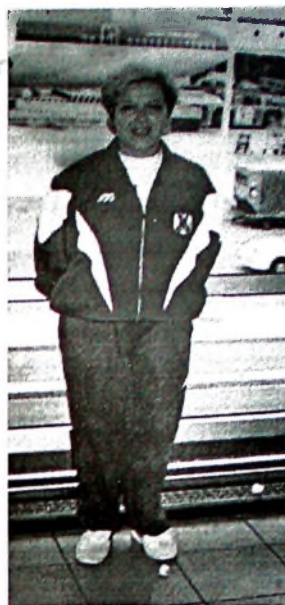
те, никога не са ни победили, независимо от оръжието, което имат. Ние имаме сърце, с което

"Вярвам в истината и правдата. Тя понякога е бавна, но все пак е достижима. Вярвам в чистото и почтено, с нищо неизпапано бъдеще, изпълно с гордост и лично достойнство. Когато казвам това, нямам предвид злодеите, които сеят смърт и убиват от високо и в тъмното. Защото спортистите винаги гледа противника си в очите. А те подло, от високо и в тъмнината, хвърлят гранати и мислят, че са невидими. Но ние и не трябва да ги видим, за да узнаем колко са зли. Те обаче не могат да убият гордостта, достойнството и ината ни, понеже това е невидимото за тях. Те нямат и не познават такива чувства. Какъв сме народ те трябва да разберат по-рано чрез спорта. Нас, спортисти-