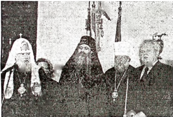
Президентът Милошевич и патриарх Алексей II дават изявление след разговора

След разговора патриарсите Алексей II и господин Павле с придружаващите ги църковни сановници бяха гости на президента и неговото семейство и на обяда, който президентът Мило-