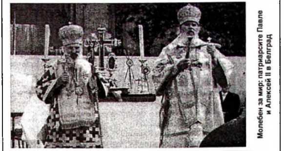
Молебен за мир, патриарсите Павле и Алексей II в Белград

Негово светейшество патриархът московски и всеруски Алексей II благодари на президента Слободан Милошевич за