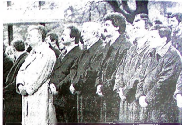
На най-голямата литургия през тоя век присъстваха и най-високи държавни ръководители

В дълга и вдъхновена беседа патриарх Алексей жестоко осъди бомбардировките и агресията на НАТО като "вакханалия на греха, започнала през светите великденски дни" и като беззаконие.