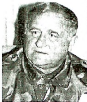
Генерал Драголюб Ойданич

"В момента, когато нашето отечество е подложено на незапомнена престъпническа агресия на НАТО пакта, който със съдействието на сепаратистичните, терористични и други субверзивни сили желае да го окупира и покори, Югославската