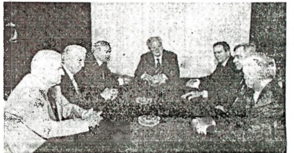
Президентът Милошевич с най-висшите функционери в страната

органи и Югославската народна банка предприемат мерки за осъществяването на необходимите явни приходи, за да се обезпечи изплащането на заплатите и пенсията.