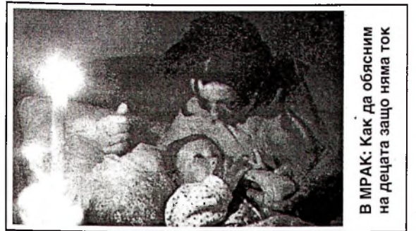
В МРАК: Как да обясним на децата защо няма ток

Преценено е, че с успешната реализация на предприетите мероприятия в областта на явните финанси се осигурява стабилност на курса на динара и на цените. Компетентните ресорни