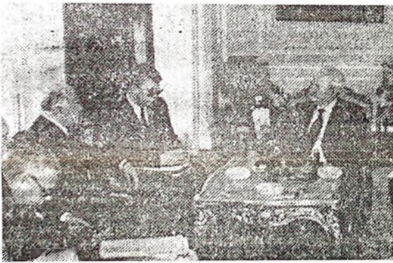
ПРЕКРАТЯВАНЕТО НА АГРЕСИЯТА - ПРЕДПОСТАВКА ЗА ВСИЧКИ РЕЗОЛЮЦИИ: Милошевич и Черномирдин

Президентът Слободан Милошевич и специалният пратеник Виктор Черномирдин подробно разговаряха за цялостта на проблемите в Косово и Метохия и начините за тяхното решаване. Съвместно е оценено, че решението може да бъде само