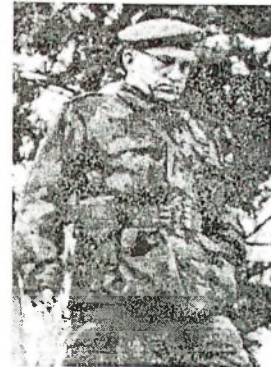
Генерал Владимир Лазаревич

Той посочи настояването на НАТО агресора с пропагандната война, особено посредством електронните си медии, които разпространяват лъжи за мнимите големи загуби и унищожени бойни системи на ЮВ, да повлияе върху съзнанието и волята на нашите