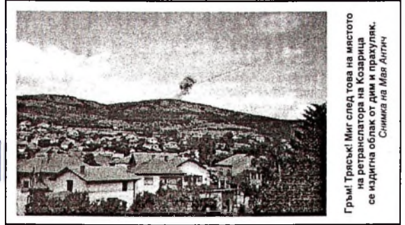
Грънч. Гресъч! Миг след това на местото на ретранслатора на Козарница се издигна облак от дим и прахулак.

На пресконференцията в Кьолн не беше даден конкретен отговор и на въпроса кога ще приключи дипломатическата акция, а с това и престъпническата агресия срещу Югославия. Британският външен министър Робин Кук само прецени, че приключването на този процес и началото на прилагането на мирния план би могло да се случи твърде скоро - през следващите няколко дни.