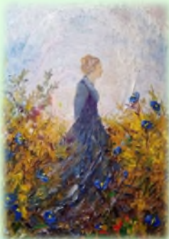
40x50 Уље на платну "Сећања"