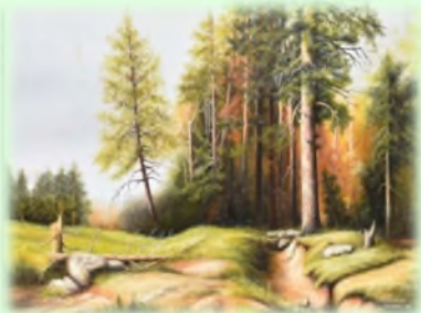
Шума 80x60 Уље на платну

Рођен 1951. год. у Босилеграду где завршава основно и средње образовање. Школовање наставља на Правном факултету у Нишу, где завршава више образовање. Учесник је многобројних ликовних колонија, а имао је и своје самосталне изложбе. Организатор је прве међународне колоније поводом 120. годишњице од смрти великог бугарског уметника Владимира Димитрова Мајстора. Претежно слика пејзаже са мотивима из родног краја, највише користећи технику уље на платну.