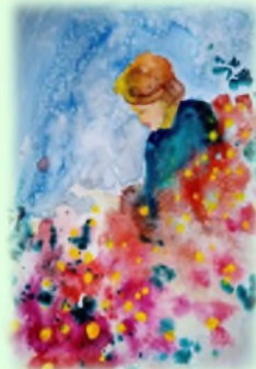
30x40 Акварел "Баба"