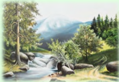
Планинска река 50x70 Уље на платну