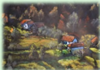
38x50 Пастел "Богослов Трап"