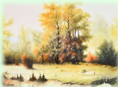
Две врбе 70x50 Уље на платну