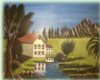
80x60 Уље на платну "Блед"