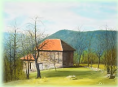
Казмирове штале 73x50 Уље на платну