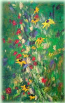
50x70 Уље на платну "Мир"

Дипломирани сликар, рођена у Босилеграду 1996. Сликарством се бави још од раног детињства. Слика претежно у техници акварела, уља и колажа. Учесник је многобројних изложби и колонија у земљи и иностранству.