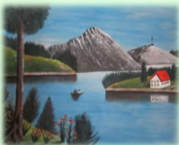
60x70 Уље на аплатну "Језеро"