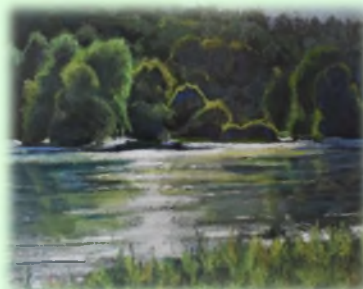
30x50 Пастел "Драговиштица"