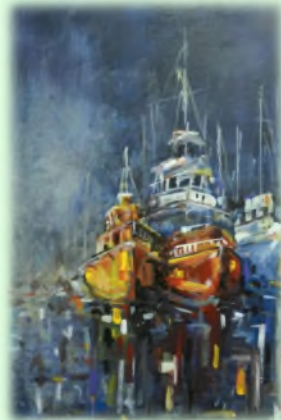
60x40 Уље на платну "Веселје"