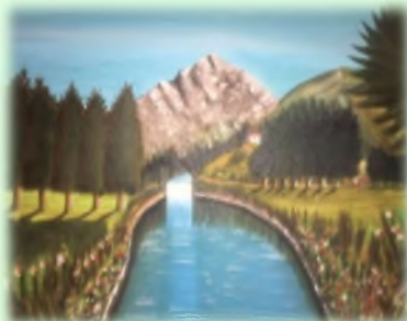
80x60 Уље на платну "Канал"

Рођен у с. Т. Лисина 1948. год. Велики је љубитељ уметности. Бави се музиком и сликањем од ране младости. Слика у техници уља и акрила, а бави се и израдом скулптура од дрвета.