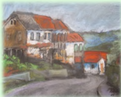
38x50 Пастел "Рајчиловци"