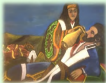
90x100 Уље на аплатну "Косовка девојка"