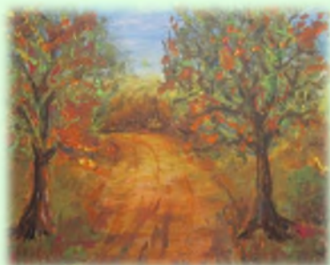
50x40 Уље на платну "Поље"