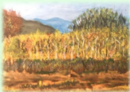
60x40 Уље на платну "Јесен у пољу"