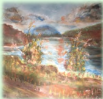
50x40 Уље на платну "Река"